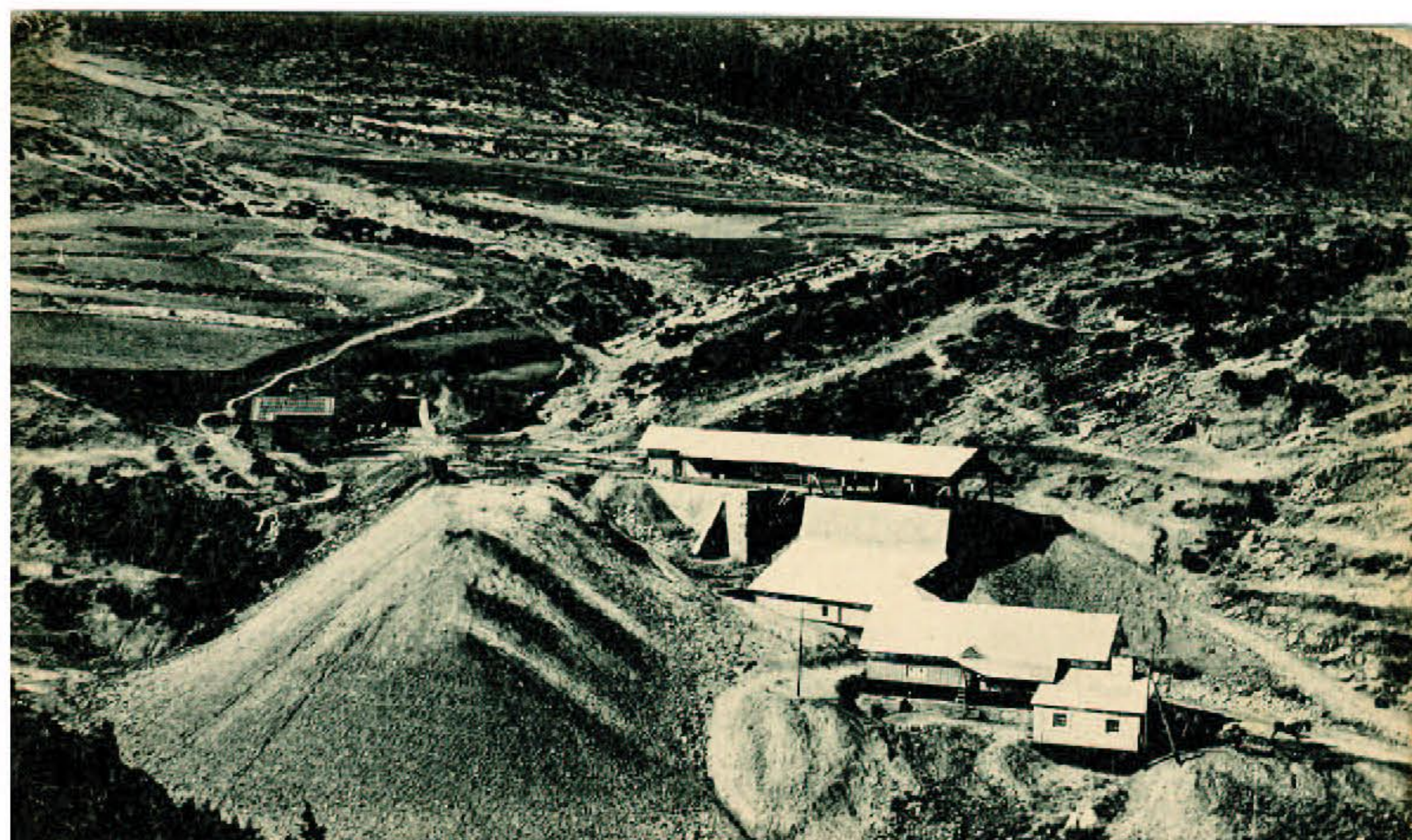
La mina de carbó Realidad, amb l'estació del telefèric, els magatzems i les muntanyes de runa. Postal de la segona dècada del s. XX.

Però el cost de les obres va descapitalitzar l'empresa que es va veure obligada, l'any 1916, a vendre el ferrocarril i l'explotació de les mines a una altra entitat, P. Oromí y Cia.