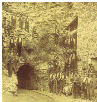
Bocamina Esteve a l'inici del s. XX.

L'any 1881 es constituí la societat "Ferrocarril y Minas de Berga" que va absorbir la societat "La Carbonera