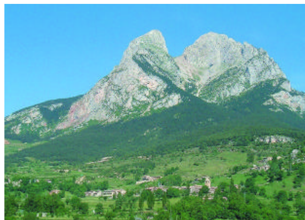
Saldes i el Pedraforca.

L'objectiu d'aquesta publicació és justament donar a conèixer tot aquest món amagat sota la muntanya