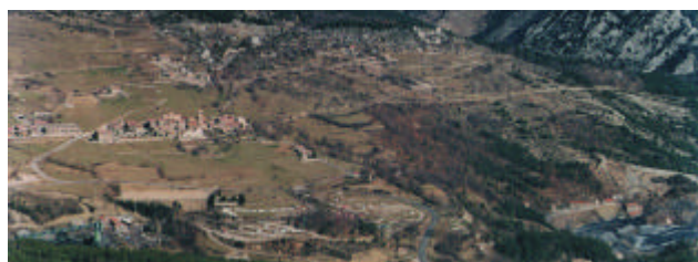
Saldes i la mina.